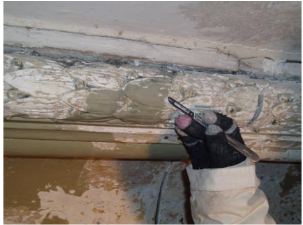
Pulizia delle foglie decorative