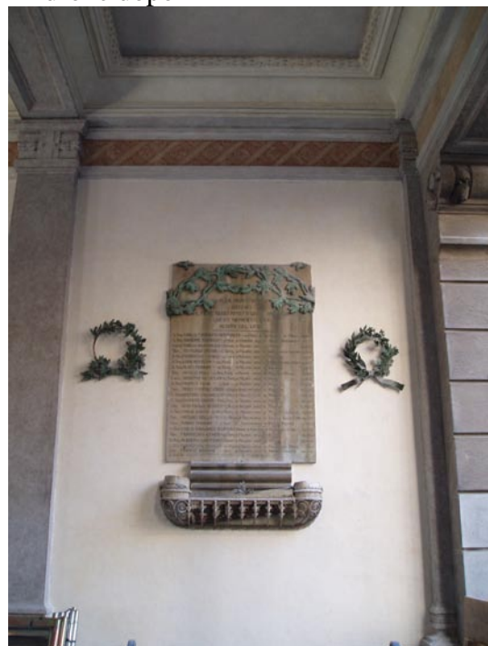
Sfondati dopo, ma prima dell' Accademia di Brera.