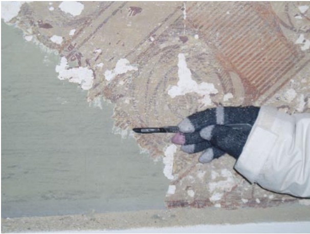
Rinvenimento fascia decorativa