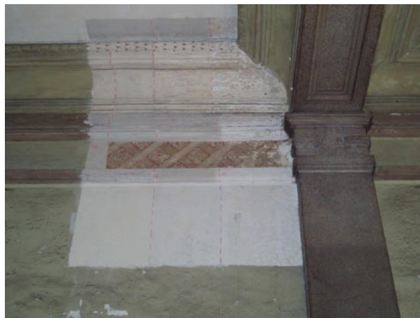
Stratigrafie - campionature