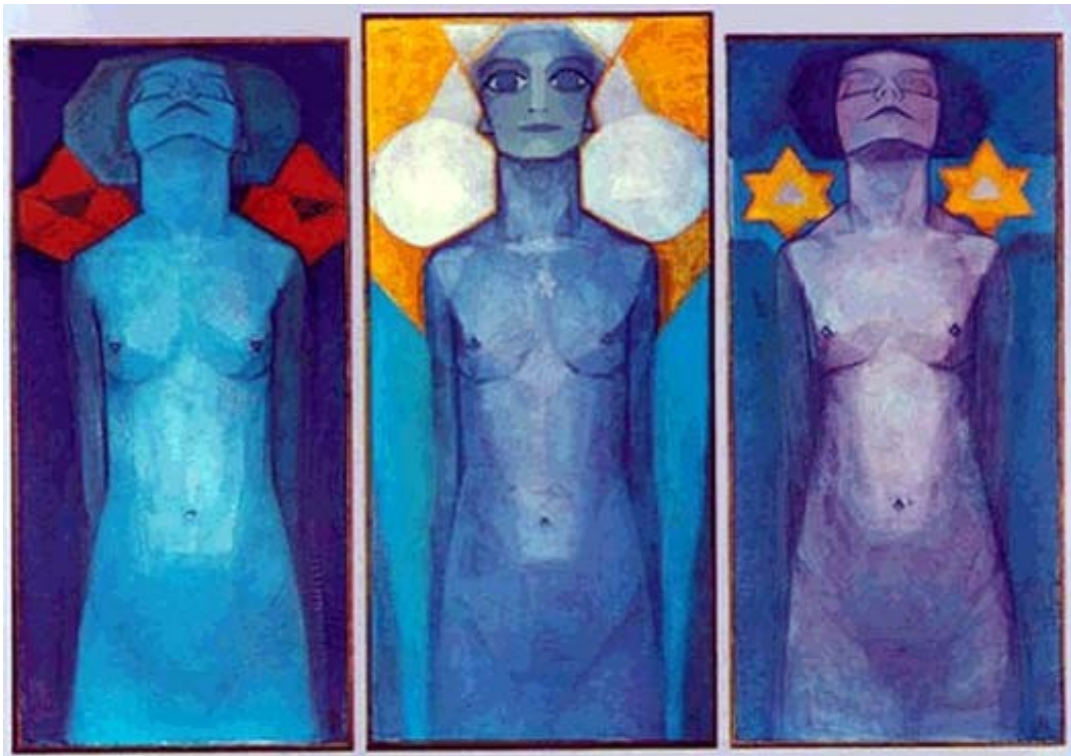
Piet Mondrian, Evoluzione, 1910-11, Gemeentemuseum, L'Aja

L'olandese Piet Mondrian (1872-1944) dipinse nel 1910-1911 "Evoluzione" (riprodotto qui sotto), opera che racchiude in sé l'estetica dell'artista: il fine dell'arte è l'elevazione spirituale e i mezzi sono semplificazione delle forme attraverso la geometria. Il colore si avvia ad abolire i mezzi toni per favorire la campitura uniforme e il chiaroscuro. Nel 1912 Mondrian si reca a Parigi e rimase però affascinato dai colori primari utilizzati da Lèger, che di lì a poco sarebbero diventati il suo unico vocabolario cromatico. Mondrian via via comunque, abbandona le linee curve ed oblique e le linee ortogonali invadono qualsiasi soggetto. Con lo scoppio della prima guerra mondiale, torna nella neutrale Olanda dove sviluppa una pittura meno soggettiva, aderendo alla teoria di Schoenmakers, secondo cui la realtà è un continuo rapporto tra opposti: luce e tenebra, attivo e passivo, maschile e femminile ecc. A suo parere i soli tre colori da considerare erano i tre colori della sintesi additiva: il blu, segno dello spazio infinito, il rosso come elemento di fusione tra lo spazio e la luce solare, rappresentata dal giallo. Ogni riferimento a oggetti, paesaggi, impressioni fu completamente abbandonato attorno al 1917, dopo la fondazione insieme a Theo Van Doesburg della rivista de Stijl. Come Malevič, anche Mondrian definì il proprio stile individuale e lo chiamò Neoplasticismo, ad indicare un nuovo modo di trattare la forma non disgiunto da preoccupazioni sociali.