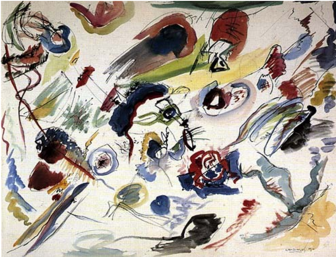
Vasilij Kandinskij Senza Titolo (Primo Acquerello astratto) ,retrodatato dall'artista 1910 Musée National d'Art Moderne Georges Pompidou., Parigi