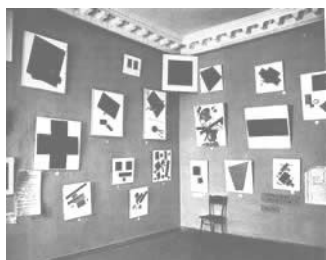
Fotografia della mostra 0.10 San Pietroburgo, 1915

Kasimir Malevič (1878-1935) è un esponente dell'Astrattismo geometrico che lui stesso definì 20 anni prima di Barr, "Suprematismo", a significare la distanza dal Naturalismo e il necessario contatto dell'arte con una sovra realtà spirituale. I quadri di Malevič sono oggetti in sé, che suscitano sensazioni superiori a quelle derivate dai sensi fisici. Essi sono fonte di immagini illusorie. Malevič si impegnò anche a livello architettonico dando vita a sculture dette "architektony" e ai disegni "planity", che avevano come fine quello di garantire nuove forme abitative per la collettività e una sensibilità umana più vibrante. Quest'immaginazione utopica non fu gradita ai vertici sovietici. Si sviluppò infatti con l'ascesa di Stalin un realismo socialista, contrario ai principi dell'Avanguardia. I quadri dell'ultimo periodo dell'artista tornarono, forse per via di un ricatto politico, al realismo classicista. Nonostante il ritorno alla figura quasi sicuramente per costrizione, i quadri di Malevič più importanti e caratteristici del suo pensiero sono peculiari dell'astrattismo geometrico. Citiamo, per fare alcuni esempi l' "Autoritratto in 2 dimensioni" del 1915, olio su tela, 80x62 cm, situato ora ad Amsterdam e il famosissimo "Quadrato nero su fondo bianco" dello stesso anno, olio su tela 106x106 cm, Museo Russo di San Pietroburgo.